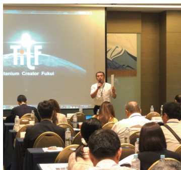
台南市企業にプレゼンを行う参加者